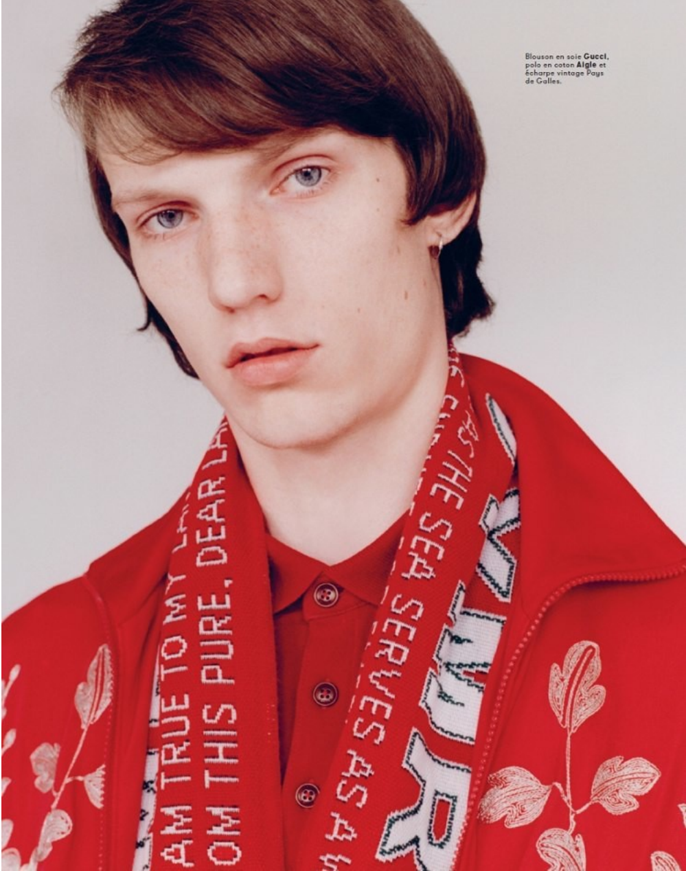
Blouson en soie Gucci, pola en coton Aigle et écharpe vintage Pays de Gullies.

HEIGHT 6' 2½" CHEST 36" WAIST 30½" SHOE 10 HAIR BROWN EYES BLUE